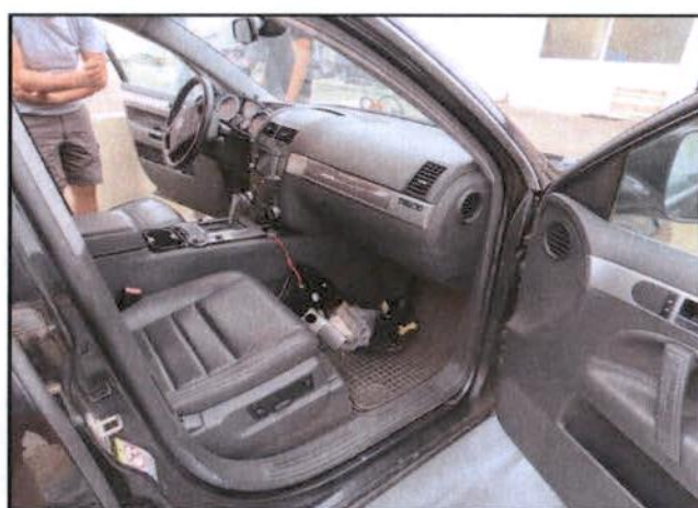
Rastavljena centralna konzola