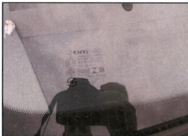
Zamjensko vjetrobransko staklo