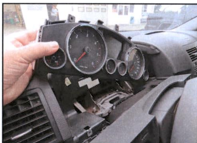
Rastavljena neispravna instrument ploča