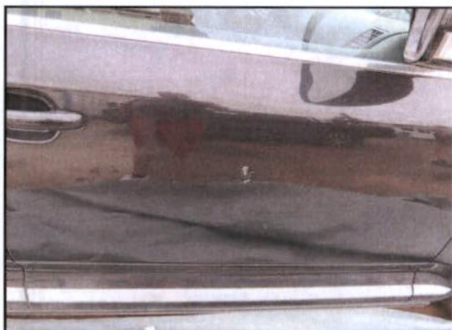
Ogrebana vrata prednja desna