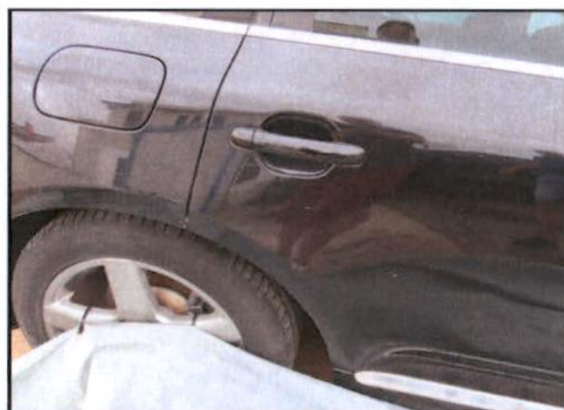
Ogrebana vrata stražnja desna