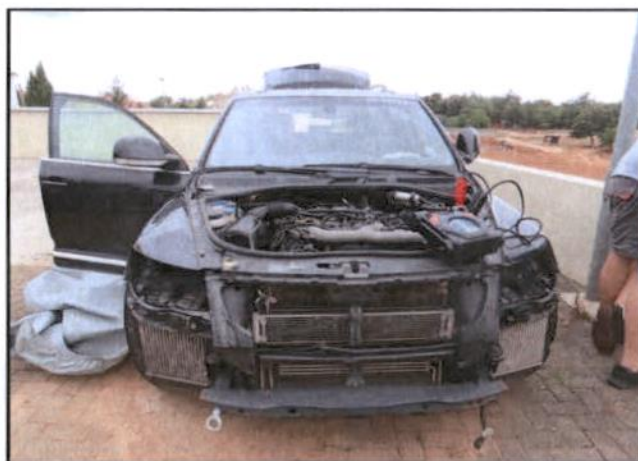
Nedostaje prednji dio vozila