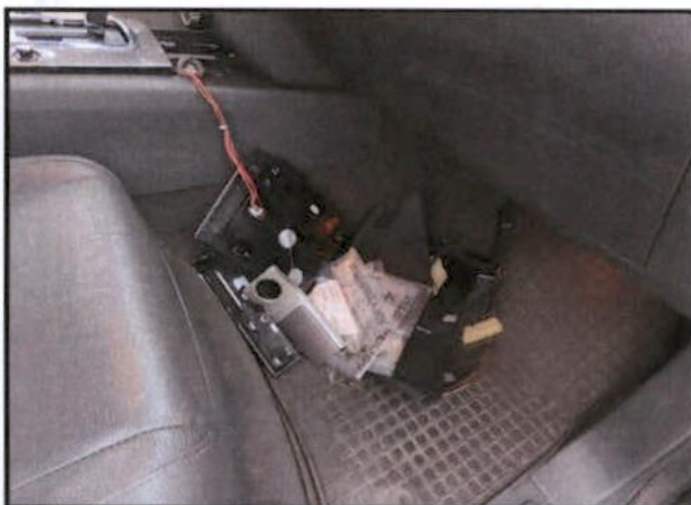
Rastavljena centralna konzola