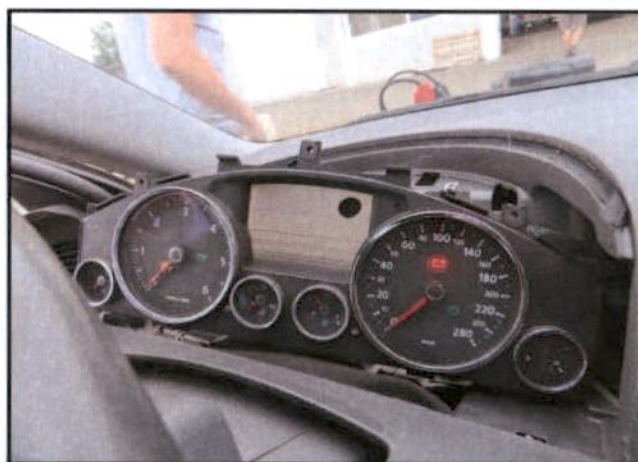
Neispravna instrument ploča